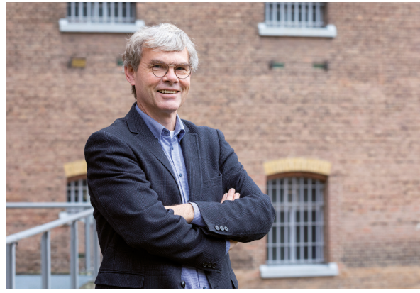
...en anno 2023